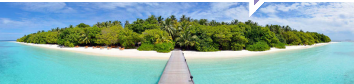
ROYAL ISLAND RESORT & SPA Camera Beach Villa, Mezza Pensione

9 giorni / 7 notti partenza 30 DICEMBRE 2017