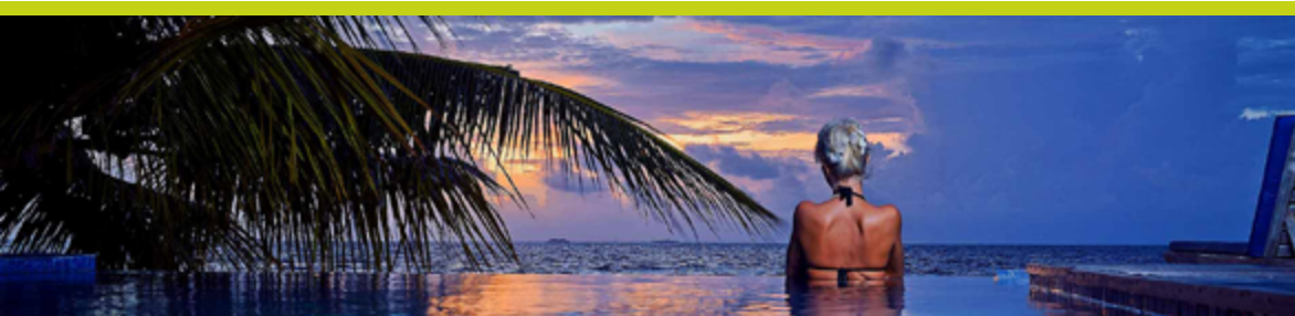
BANDOS MALDIVES Camera Standard, Mezza Pensione