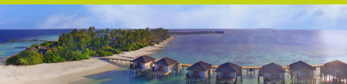
AMARI HAVODDA MALDIVES Camera Standard Beach Villa, Pensione Completa