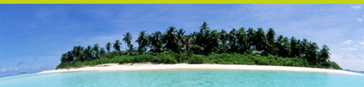
DHIGALI MALDIVES Camera Beach Villa, Mezza Pensione