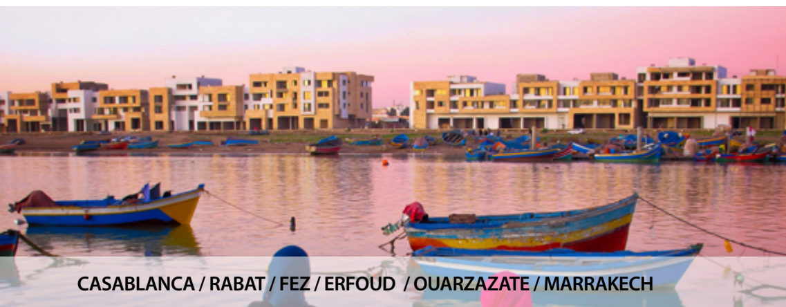
CASABLANCA / RABAT / FEZ / ERFOUD / OUARZAZATE / MARRAKECH