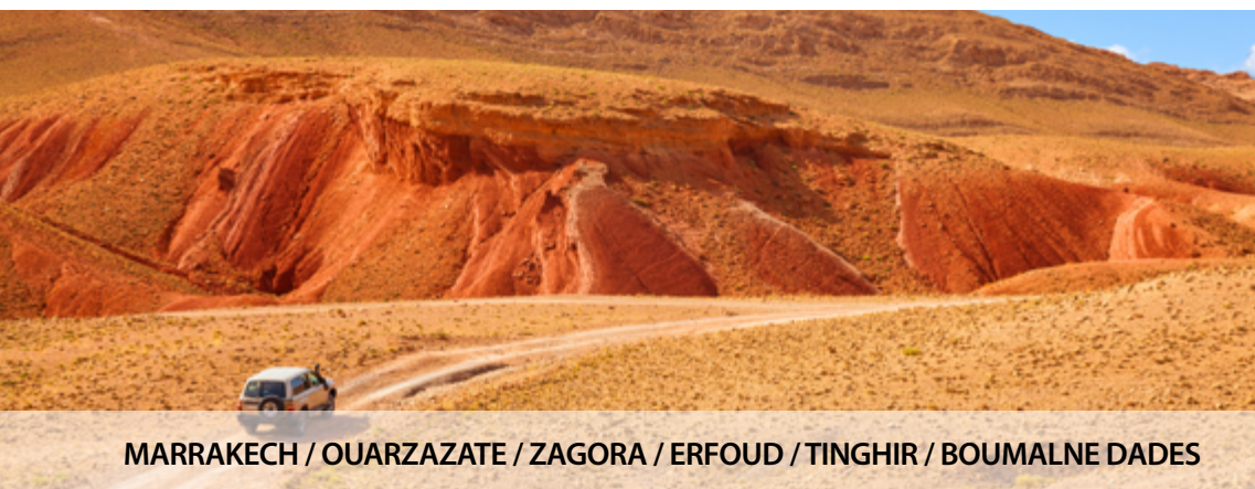
MARRAKECH / OUARZAZATE / ZAGORA / ERFOUD / TINGHIR / BOUMALNE DADES